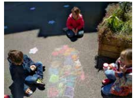
Une récréation déconfinée