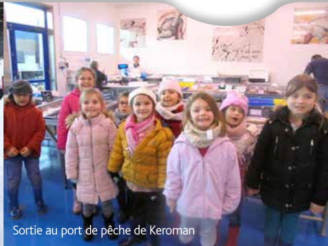
Sortie au port de pêche de Keroman