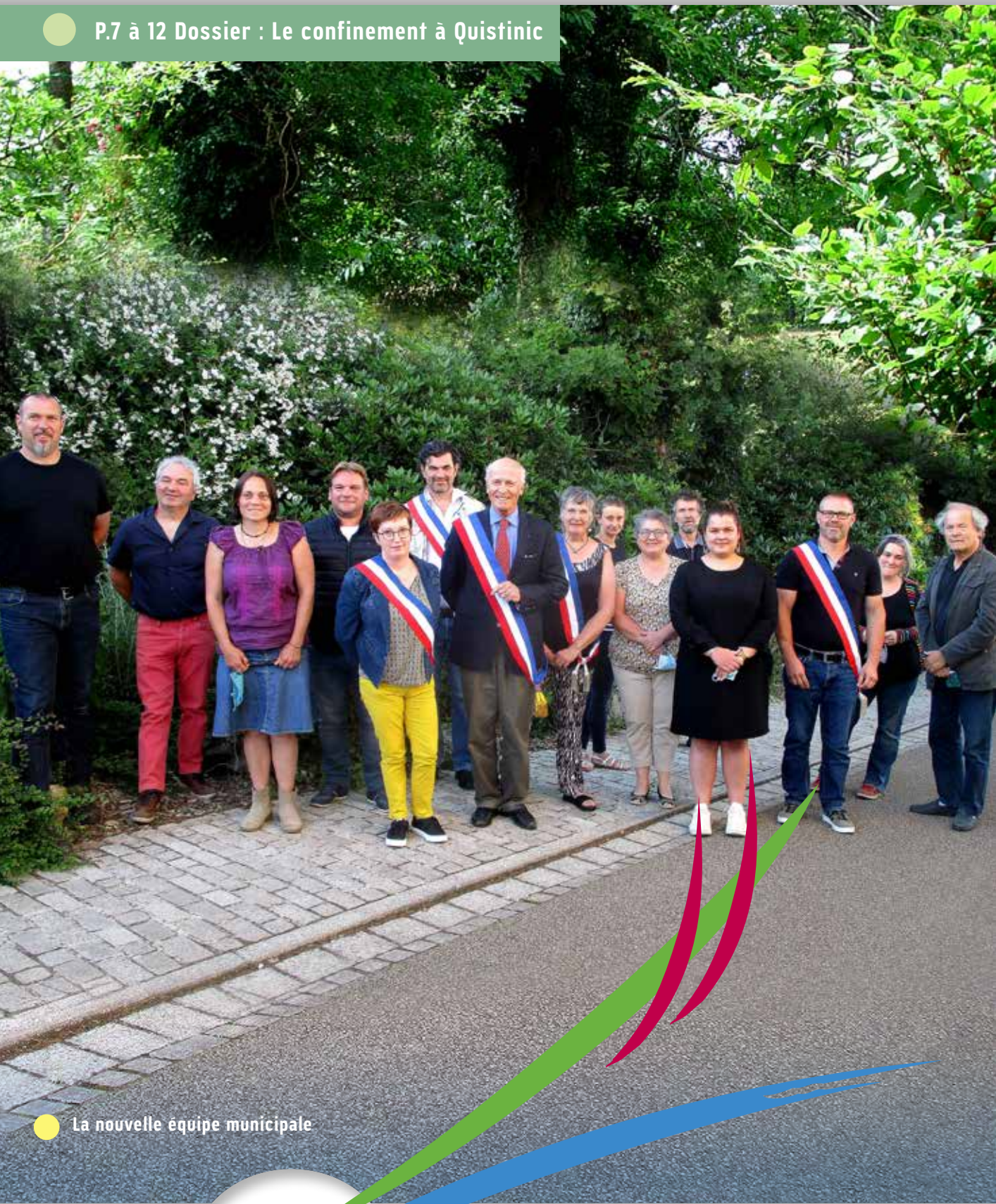
La nouvelle équipe municipale