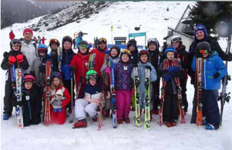
Classe de neige dans les Pyrénées