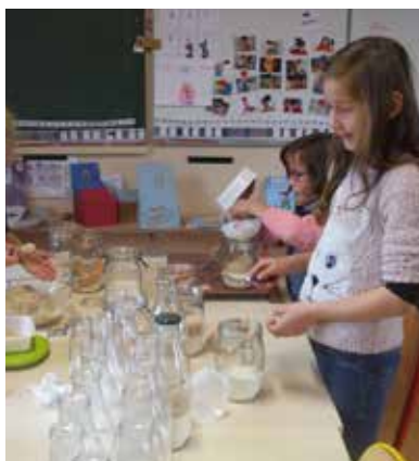
Préparation du marché de Noël

L'an passé, l'Amicale a organisé, entre autre, un ramassage de pommes, un repas ouvert à tous en mars, des ventes de chocolats à Noël et à Pâques, de plants de légumes au printemps, de bouillie de millet sur les marchés d'Automne et de Noël. L'association prend d'ailleurs en charge toute la restauration ainsi que la vente de sapins sur ce dernier.