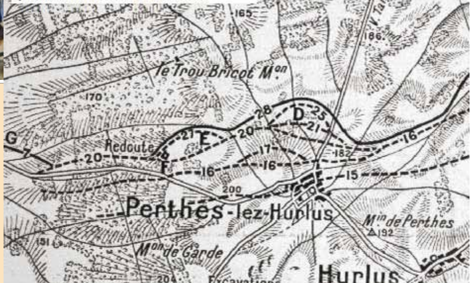
opérations du 15 fév. au 7 mars 1915

le champ de bataille à Mesnil-le-Hurlus.