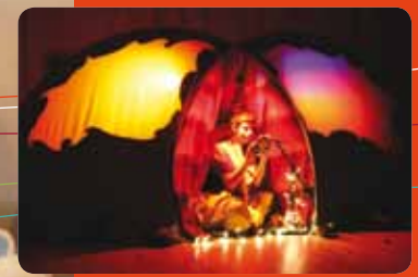
Spectacle de Noel