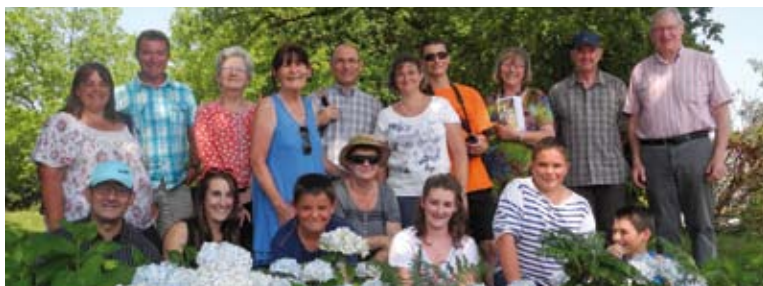
Accueil de suménois à Quistinic