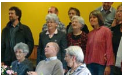
doyennes, doyen et élu

du mois à la salle du conseil, mise gracieusement à la disposition du club par la municipalité.