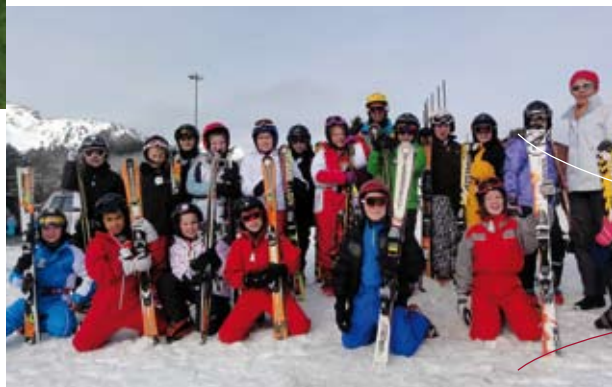
Cycle 3 Classe de neige au Mourtis

Ils ont participé au pardon de la St Mathurin et seront à nouveau invités à venir se costumer avec les vêtements traditionnels bretons pour participer à la procession. C'est toujours un plaisir pour eux de faire perdurer la tradition... Un grand merci aux personnes qui prêtent les