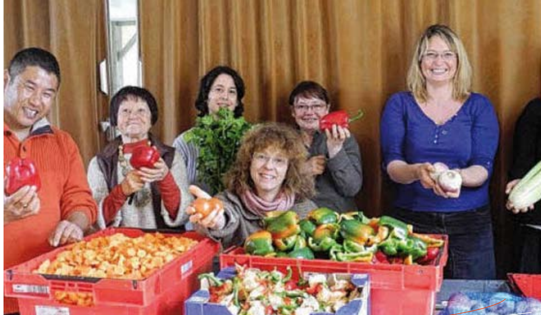
Couscous du 29 mars