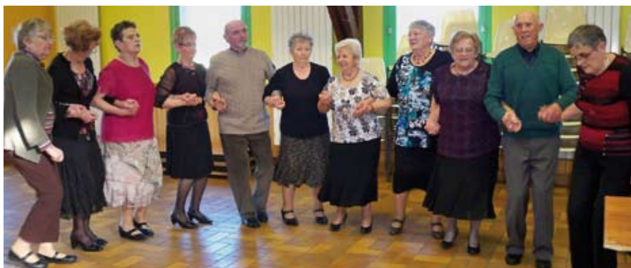
Après-midi dansant après le pot au feu en mars

L'après-midi «loto» est très appréciée de la quarantaine de participants qui se retrouvent tous les premiers mardi