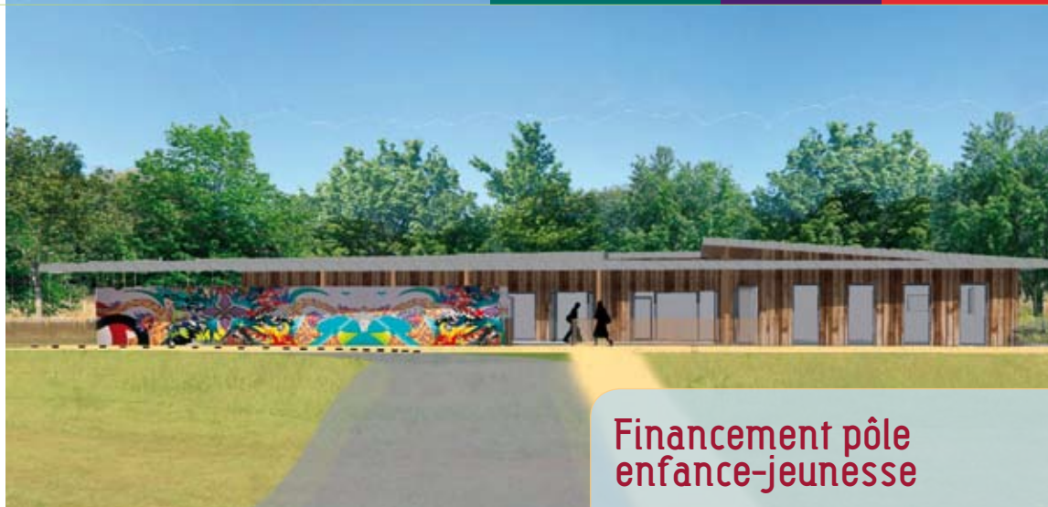
Le Pôle enfant