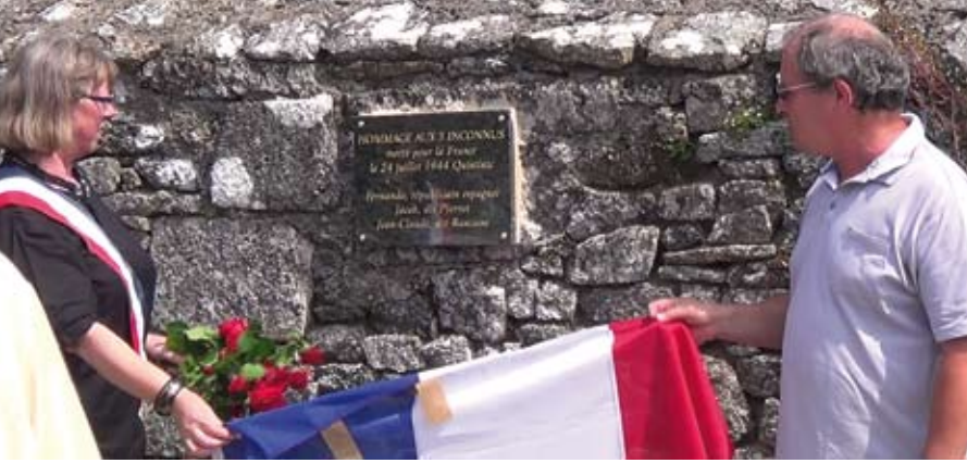
plaque au cimetière