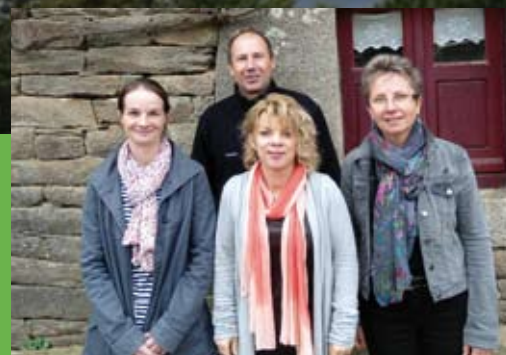
Poul-Fetan, une équipe

bulletin d'informations municipales numéro de Janvier 2015