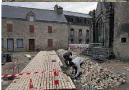
Rue de la mairie