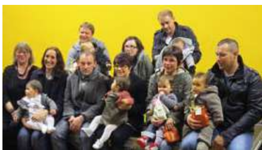
bébés de l'année