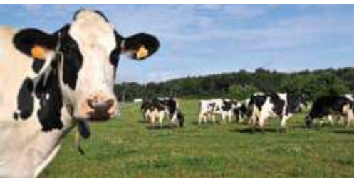
Exploitation agricole à Languidic