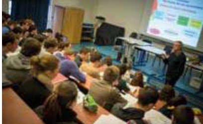
Amphithéâtre Université de Bretagne Sud (UBS)