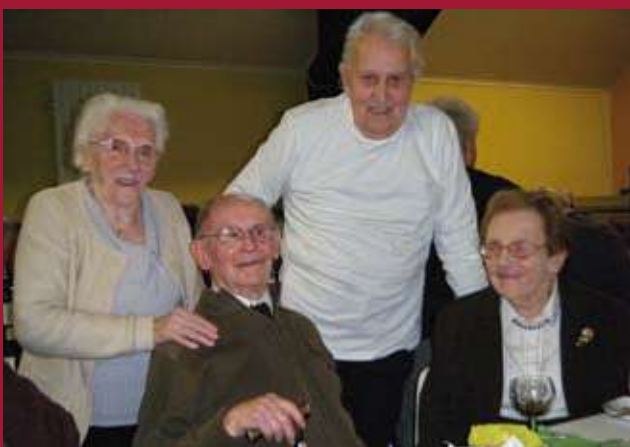
La fête des anciens