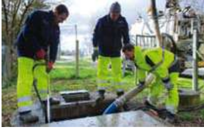
Equipe de la direction Eau et assainissement sur le terrain