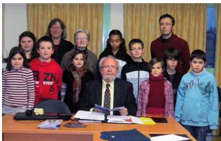
Visite du Sénateur

L'occasion de ce déplacement méritait un petit détour par la Tour Eiffel, les quais de Seine et autres monuments parisiens en utilisant le métro, pour la première fois pour beaucoup d'entre eux.