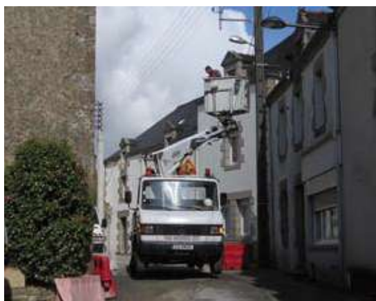
Rue de l'église

Si des travaux s'avèrent nécessaires il existe des éco-prêt à taux 0%