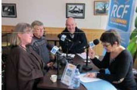
Radio Ste Anne