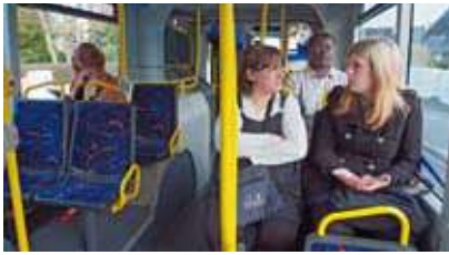
Bus en service sur le réseau de transports collectifs de Lorient Agglomération