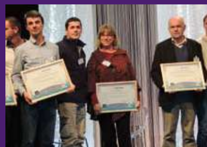
Remise des trophées à Rennes

Le 24 janvier à Rennes, la Région Bretagne a décerné le prix «Zéro Phyto» à trois nouvelles communes : Quistinic, Sainte-Brigitte et Kergrist.