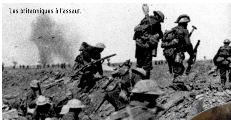
Les britanniques à l'assaut.

« Mon cher ami, Je n'aurais jamais cru qu'il pût encore y avoir quelque chose qui surpasse l'enfer de Verdun. Là-bas, j'ai souffert atrocement. Maintenant que cela est passé, je puis le dire. Mais ce n'était pas assez : maintenant nous avons été envoyés dans la Somme. Et ici tout est porté à son point extrême : la haine, la déshumanisation, l'horreur et le sang. (...) Je ne sais plus ce qu'il peut encore advenir de nous, je voulais vous sauver encore une fois. Peut-être est-ce la dernière. » Lettre de Stefan Zweig, soldat et écrivain autrichien à un ami